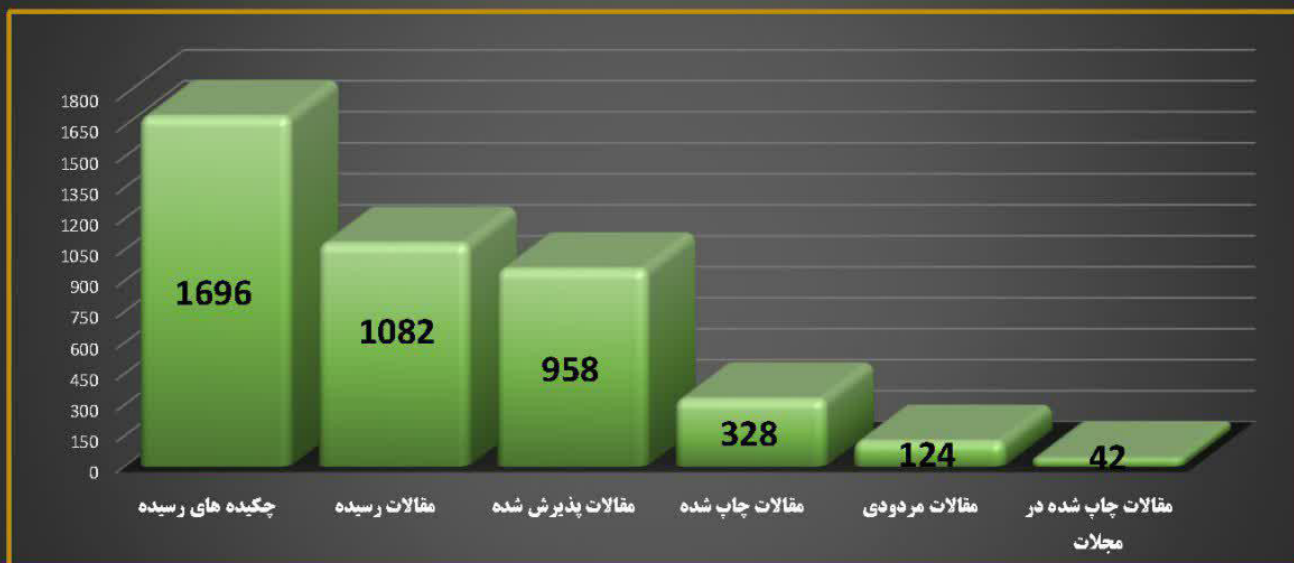
مقالات کنگره بین‌المللی گام دوم انقلاب اسلامی از منظر قرآن و حدیث

معاونت پژوهش مجتمع آموزش عالی قرآن و حدیث