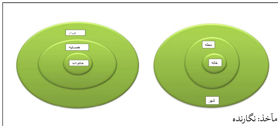
شکل (۱) - مدل جایگاه خانه و خانواده در جامعه و شهر اسلامی - ایرانی

یکی از ضروریات تشکیل خانواده پایدار وجود خانه پایدار است. اگرچه تشکیل خانواده مقدم به نظر می‌رسد اما برای پایدار ماندن وجود خانه یک ضرورت است. کیفیت محیط خانه باید نیازهای جسمی و روحی روانی از جمله امنیت و ایمنی را فراهم کند.