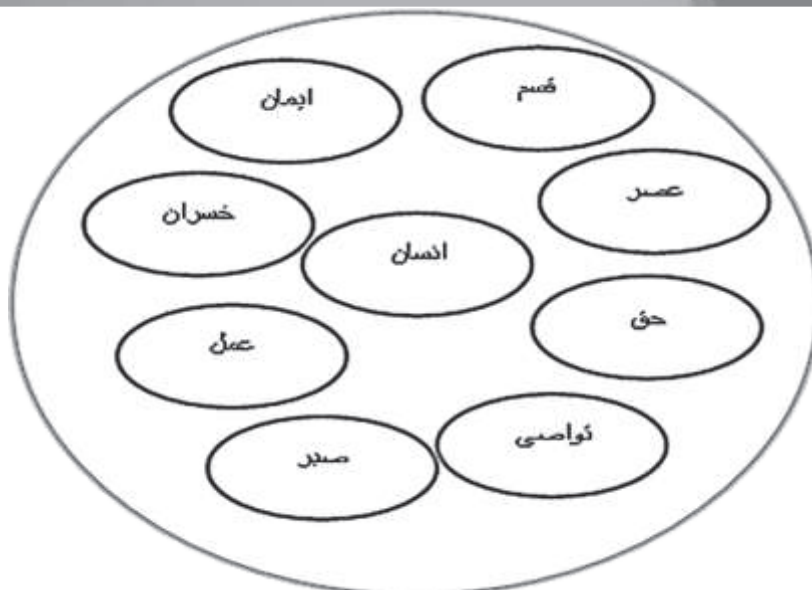
نمودار ۳: شبکه مفاهیم سوره عصر